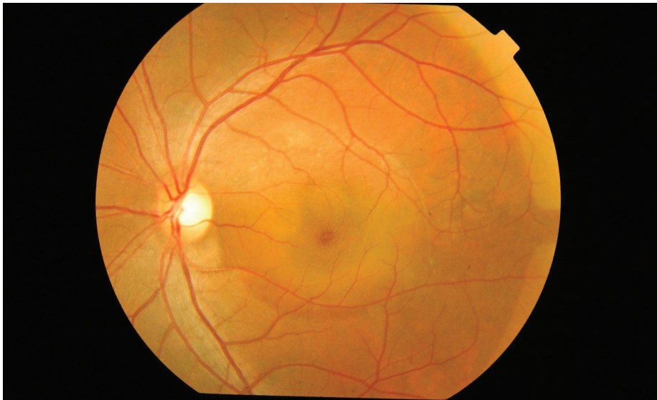
Fotografía color del fondo del ojo izquierdo de un hombre de 33 años de edad con CSC bilateral. Mallika Goyal, MD, Apollo Health City, India. Coriorretinopatía serosa central. Retina Image Bank 2012; imagen 2117. ©American Society of Retina Specialists.

La CSC ocurre con más frecuencia en adultos jóvenes y de mediana edad. Por motivos que se desconocen, los varones desarrollan esta afección más comúnmente que las mujeres. La pérdida de la visión generalmente es temporal, pero a veces puede volverse crónica o repetirse.